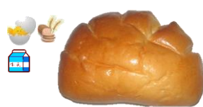
クリームパン 1個 120円 甘さひかえめ 女性に人気