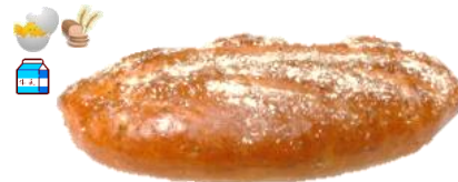
ノア 1個 250円 クルミが挽きたて