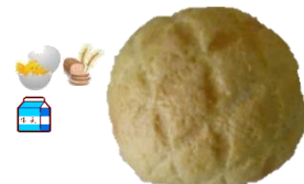
メロンパン 1個 120円 メロン好きにはたまらない