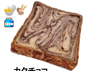
カクチョコ 2枚 250円 1枚 140円 チョコがぎっしり!!