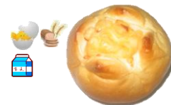
チーズパン 1個 110円