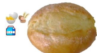
バターフレンチ 1個 110円 きわだつ シュガーバターの甘さ