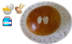
ミルクパン 1個 80円 甘くて切ない、...