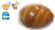
バターロール 1個 70円 朝はこれで決まり!