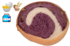
ベリーの 1個 100円 自家製のブルーベリーを ふんだんに使って☆