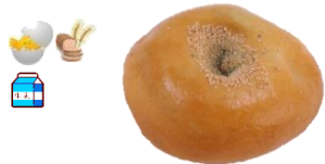
あんぱん 1個 120円 バター風味をプラス