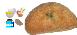
カレーパン 1個 160円 じっくり煮込んだ 自家製カレー