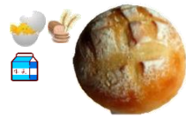
テーブルロール 1個 70円 simple is best