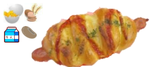
ウイナーロール 1個 160円 お昼に欠かせない一品！

惣菜パン 1個 160円 季節ごとに 旬の野菜をトッピング (詳しくは店頭及び 注文書でご確認下さい)