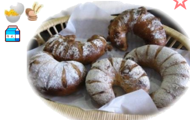
レザン 1個 160円 カレンズとクルミの相性抜群