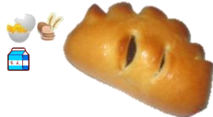
チョコパン 1個 120円 昔ながらのチョコパン