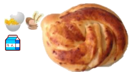
みそあんぱん 1個 120円 みそダレが香ばしい