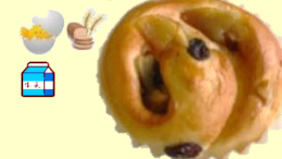
りんごパン 1個 90円 (11月～3月) りんごとシナモンたっぷり