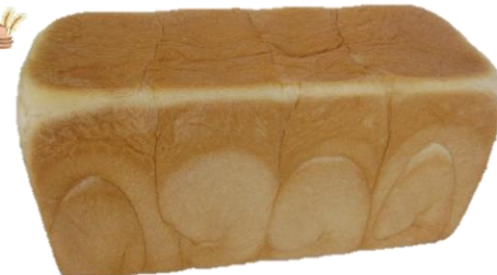
プルマンブレッド 1本 660円 1斤 330円 ハーフ 180円 2種類の国産小麦をブレンド! ピカイチの食パン