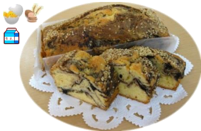
パウンドケーキ 各種 600円 しっとり甘さひかえめ