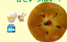
桜あんぱん 1個 130円 (4月～5月)