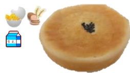
べったりあんぱん 1個 120円 老若男女に愛され、、、