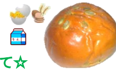
かぼちゃパン 1個 70円 かぼちゃが生地に 織り込んであります☆