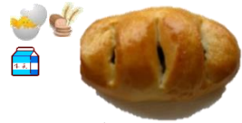
レーズンパン 1個 90円 定番のレーズンパンに グラニュー糖のトッピング