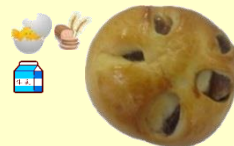
豆ぱん 1個 120円 甘党 大歓迎！！ (12月～5月)

惣菜パン 1個 160円 季節ごとに 旬の野菜をトッピング (詳しくは店頭及び 注文書でご確認下さい)