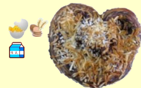
チョコハート 1個 160円 (12月～3月) 甘さいっぱい！